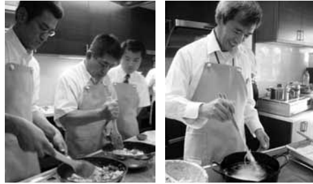
いつもは奥様に任せ通りの料理に挑戦! 皿なら温度設定も簡単です。

岩井木材(株)枚方支店でオール電化研修会を開催。会場は関西電力エレクトック新大阪とエルハウス(三国)。機器の比較や体験が出来たり、オール電化ハウスで実際の生活を実感できたりと、オール電化のご提案にぜひとも活用していただきたい施設です。