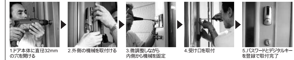
1.ドア本体に直径32mmの穴を開ける 2.外側の機械を取付ける 3.微調整しながら内側から機械を固定 4.受け口を取付 5./パスワードとデジタルキーを登録で取付完了 メーカー施工で所要時間は2時間程度でした。(ドアの形状や微調整の有無によってばらつきがあります)

今回、お客様に防犯対策の提案をするべく、「まずは自分が試してから」とご自宅に電子錠「楽々ロック」を取り付けていただきました。