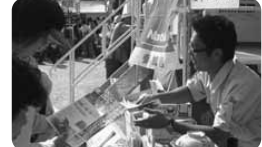
住まいの構造改革推進協会の正会員でもある畑中工務店 耐震住宅の大切さもしかりアピール

一面のテントを借りて、畑中工務店様も毎年出店されています。一大イベントというだけあり、絶好のお祭日和の中、会場は来場者で埋め尽くされました!