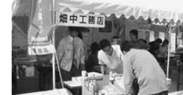
お祭りは地域の方とふれあえることが貴重なですね