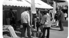
当社も材木販売、IHヒーター実演等でご協力させていただきました

(株)小阪工務店様の自社倉庫にて行われる盛大な感謝祭。日ごろの感謝を込めて地域の方々に楽しんでいただく毎年開催しています。カラーゼールはもちろん、餅つき、子どもたちに人気のマジックショーなど盛りだくさん! 近隣の公園では、高槻市とJAによる「農業祭」が同日開催。そのため、いつもは落ち着いた雰囲気のある会場周辺は早朝からたくさんの人! 相乗効果でどちらのイベントも大盛況でした。