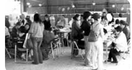
歩き回ってひとやすみ。秋祭りでは特に温かいものが良く売れますね