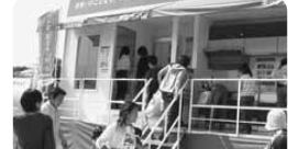
松下電工のショールームカーも出動!たくさんの方が足を止めてくれました