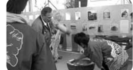
餅つきは毎年大好評!出来上がる頃には長蛇の列ができています