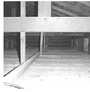
筋交いが入っているか