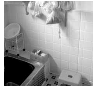
浴室はタイルの亀裂等により 床下に水が回る可能性があるか タイルが浮いていないか等...