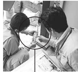
シュミットハンマー コンクリート強度の調査(シュミットハンマー)