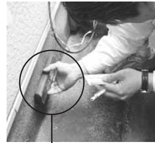
センサー 鉄筋がきちんと入っているか(センサー)