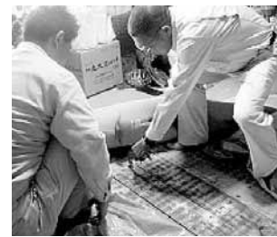
白アリの被害はないか、湿気の度合 土台と大引きの含水率 土台が基礎の上にきちんとついているか