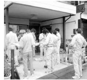
周りの環境をみて、地盤の状態を仮に判断してみる 目視で外壁と基礎のクラックの大きさを確認