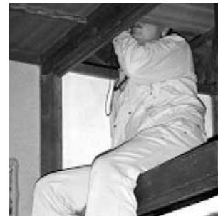
柱の位置 屋根、内壁の下地材