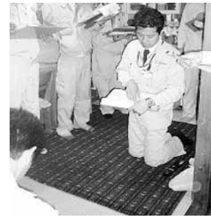
柱の位置 壁の配置バランス 下地材の種類