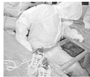
床の束がきちんとしたピッチで入っているか 目立ったクラックはないか 基礎の強度(シュミットハンマー)