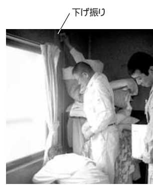
下げ振り 柱がまっすぐ立っているか