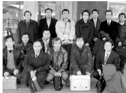
導入研修 in 福岡

昨年10月、大阪IMP会議室にて開催しました「耐震セミナー」に、約60社の工務店様にご参加いただき、耐震補強の重要性と耐震技術認定者取得の必要性をお伝えしました。その際ご賛同いただいた皆さんと福岡で開催の導入研修に参加し、耐震診断の普及と耐震