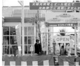
「エコライフ貝塚」オープンの様子

去る3月25日、イワイグループとして初めての業態、「太陽光発電の店」を貝塚市にオープンしました。貝塚市や地元業界の要請にイワイグループとして応えたもので、太陽光発電装置を屋根に取り付けた新しい感覚の展示場を持った営業拠点としてのスタートです。岸和田イワイ本社の貝塚市担当営業チームはエコライフ貝塚にて今後の営業活動を行い、貝塚地区のお得意先様へのサービスをレベルアップしてまいりますので、従来にも増してご支援の程お願いいたします。